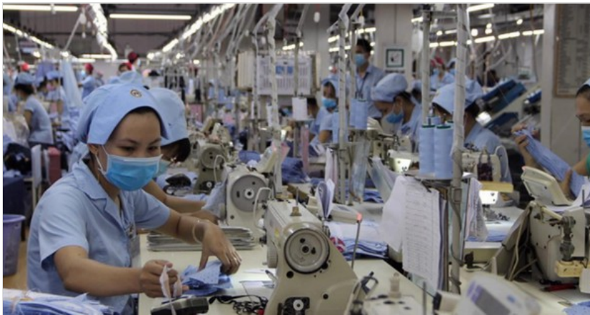
Nếu doanh nghiệp không phải nộp khoản phí công đoàn, lương của người lao động có cơ hội được cộng thêm.

Và nếu nhìn dài hạn, tính hợp lý của nhiều khoản thu từ doanh nghiệp , trong đó có kinh phí công đoàn, cũng cần phải được cân nhắc kỹ.