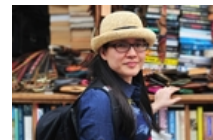
PGS người Việt ở ĐH số 1 nước Úc: 'May mắn, tôi được học trường chuyên'