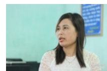
Xác minh thông tin học sinh cảm gậy đánh cô giáo tố bị 'tru dập' ở Quốc Oai