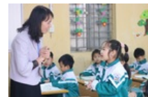
Giáo viên vất vả với yêu cầu minh chứng của Bộ GD-ĐT: 'Không rõ để làm gì'