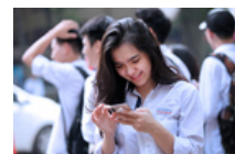
Trường ĐH Y Dược TP.HCM tuyển 2.360 chỉ tiêu theo hai phương thức