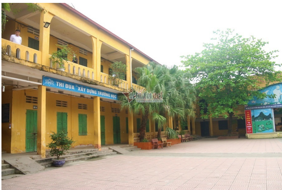
Nhiều giáo viên Trường Tiểu học Sài Sơn B mong sớm có kết luận thanh tra để cô trò sớm trở lại không khí và nhịp dạy học bình thường.

Theo cô, sự việc dù chưa rõ đúng sai nhưng ảnh hưởng đến uy tín của nhà trường lẫn bản thân cô cũng như các đồng nghiệp. Do đó, cô giáo này mong muốn các cơ quan chức năng sớm làm rõ mọi việc.