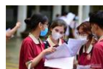
ĐH Xây dựng dùng kết quả bài kiểm tra tự duy của Bách khoa để xét tuyển