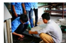
Kiến nghị Thủ tướng cho phép các trường nghề được dạy văn hóa cấp THPT