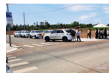
Chiều trò bán đất nền 'biết rồi, khổ lắm, nói mãi' vẫn khiến nhiều người sập bẫy